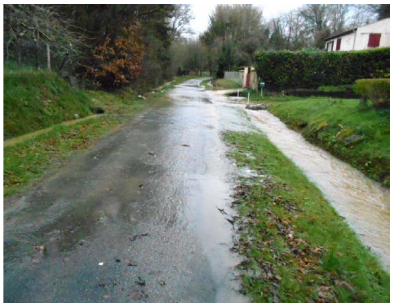
Chemin de Montvolland

La solution n'est plus le busage des fossés mais au contraire des systèmes qui permettent à l'eau de s'infiltrer et d'être retenue dans les parties amont avant d'être relâchée progressivement vers l'aval.