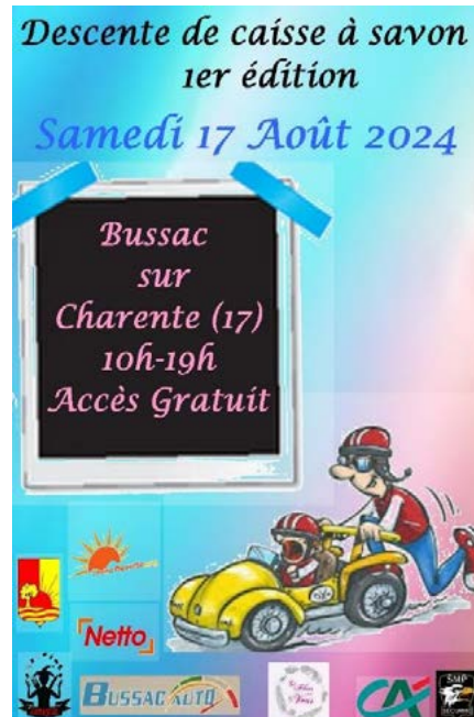
Quelques exemples de caisses à savon...