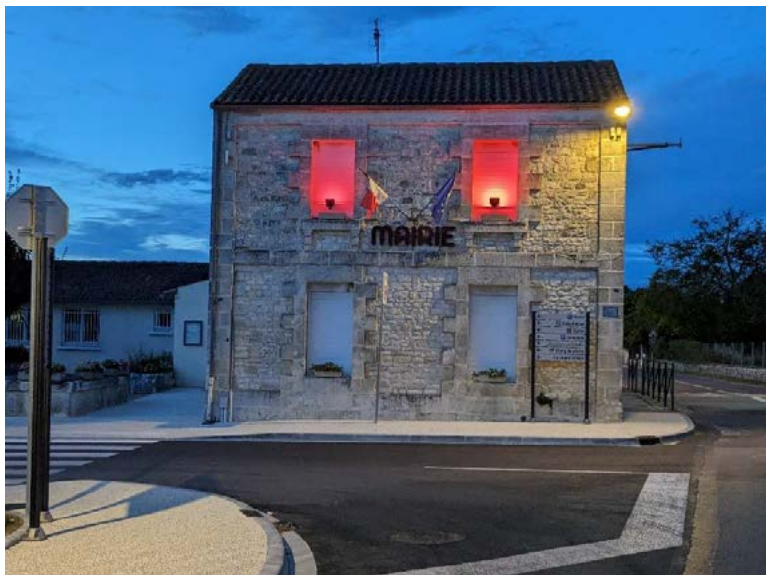
La mairie aux couleurs d'Octobre rose