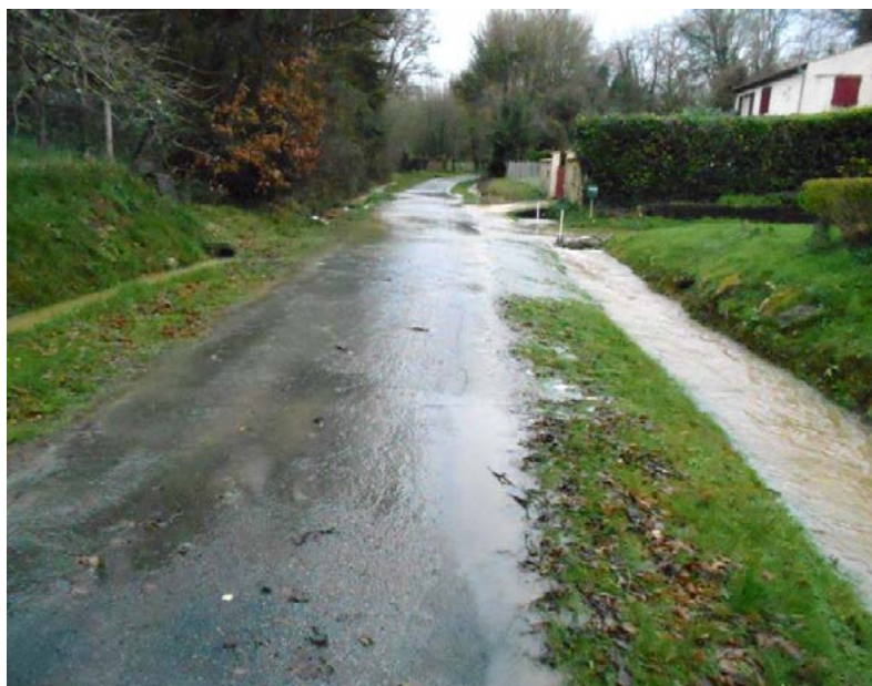
Chemin de Montvollant

La solution n'est plus le busage des fossés mais au contraire des systèmes qui permettent à l'eau de s'infiltrer et d'être retenue dans les parties amont avant d'être relâchée progressivement vers l'aval.