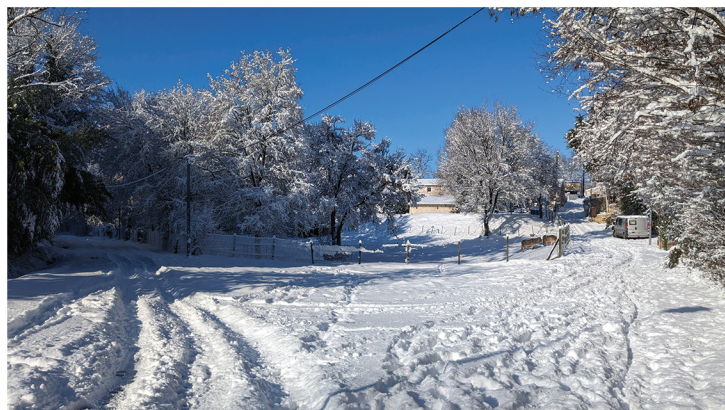
Vue depuis "l'épingle" de Montvillant

Comme beaucoup d'entre vous n'ont pas pu sortir de chez eux, envoyez nous quelques unes de vos plus belles photos. Elles serviront d'archives pour la commune et nous en publieront une sélection dans le prochain Bussac Info afin que tous ceux qui n'ont pu se déplacer puissent en profiter. N'oubliez pas de renommer vos photos avec le lieu de prise de vue.